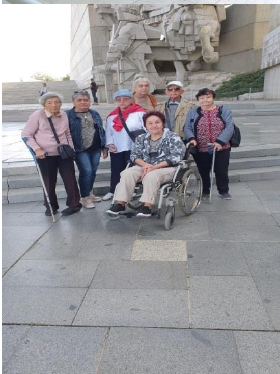
Снимка от 09.10.2024г. Шумен

Във втората екскурзия се включиха 29 членове. Дестинацията този път бе към гр. Елена. Първата спирка на екскурзиантите бе Къпиновски манастир „Свети Никола“, свято и заредено с положителна енергия място. Последва обиколка в Къмпинг „Къпиновски манастир“, река „Веселина“ и красивия водопад