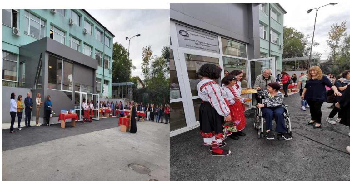
Figure Зоткриване ДСП-11.10.2024г.

В РО Търговище през това тримесечие продължи популяризирането на Проекта на МТСП „Предоставяне на високотехнологични помощни средства за хората с трайни увреждания“. Предоставяха се информации и консултации, разпечатваха се и се попълваха документи. Дирекция „Социално подпомагане“ в Търговище вече разполага с обособен вход и административен салон, пригодени за хора с увреждания по проект „Модернизация на Агенцията за социално подпомагане“, финансиран по Националния план за възстановяване и устойчивост. Ремонтът на сградата на Дирекцията е на стойност 238 000 лв. На 11.10.2024г. реновираната сграда бе открита с водосвет за осветяване. По покана на Дирекцията на церемонията присъстваха председателите на РО на СИБ – Търговище и ОО- Търговище, членове. Проявата бе отразена в сайта на АСП, Информационен бюлетин „Кураж“, БТА и местни медии.