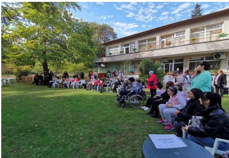
Снимка от 15.10.2024г.

Уникален по рода си концерт- спектакъл, с участието на състави от различни краища на страната, наречен „Завръщане в образа“ посетиха пет от членовете на ОО – Търговище. Поканата бе отправена от организатора и Председател на Фолклорен клуб „ОМАЯ“. С удовлетворение установихме, че Драматичния театър в града вече е осигурил достъп на хора с увреждания, които са на инвалидни колички, до концертната зала, в която са обособени и места за тях. Налични са отделен приспособен вход и асансьор.