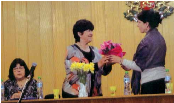
Зам. кметът на общината поздравява председателката на организацията