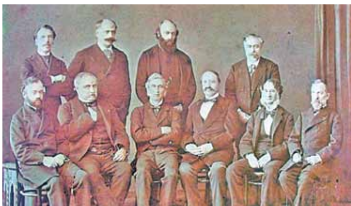
Участници в Цариградската конференция