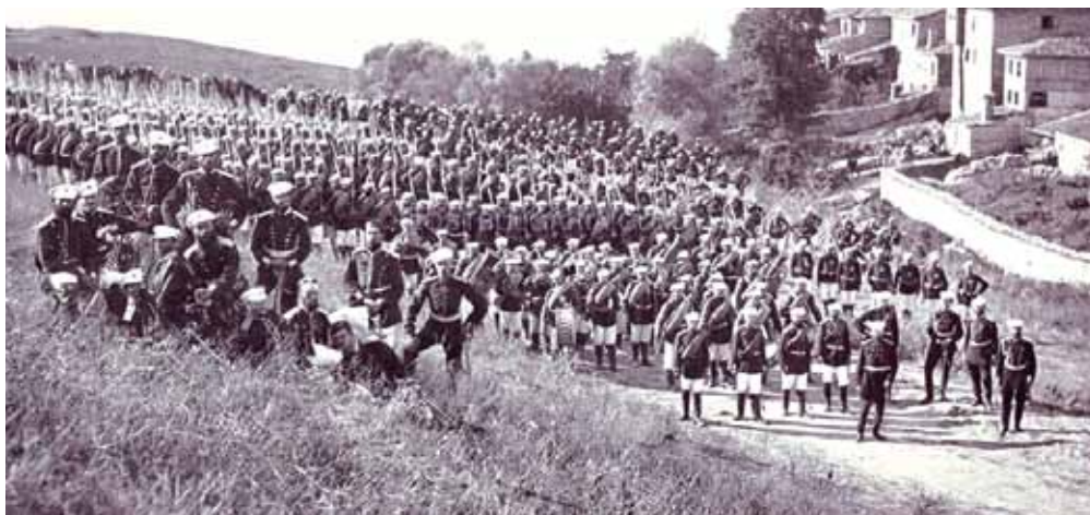
Гвардейци пехотинци пред Яръм Бургас - Турция