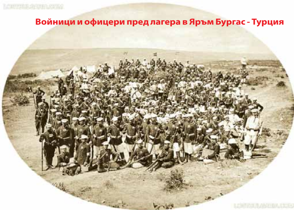
Войници и офицери пред лагера в Яръм Бургас - Турция