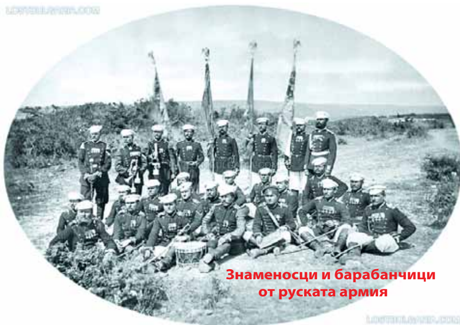
Знаменосци и барабанчици от руската армия