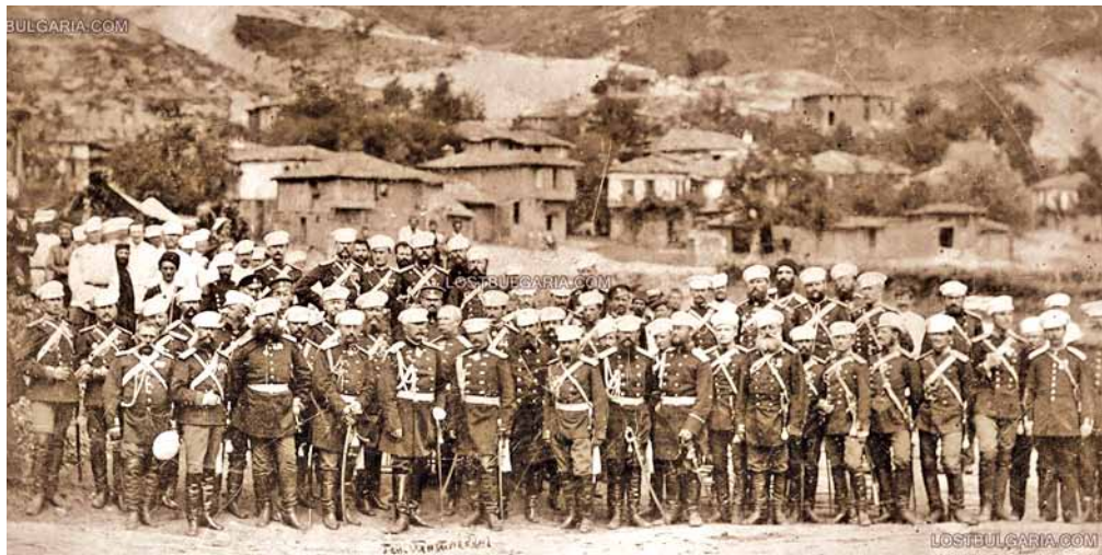
Генерал Тотлебен пред Сан Стефано