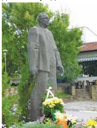
Паметник в с. Бояджик

Второ посещение Атанасов прави през май – юни 1985 г., като две години преди това е избран за чуждестранен член на БАН. Георги Йорданов заявява: „Бихме искали да вярваме, че някъде в дълбоките корени на Вашето чудесно творение, плод на изключително научно прозрение, лежи зрънце от откривателския порив на талантливия български народ“, с което де факто обявява Атанасов за българин. Награден е с орден „Народна Република България“ първа степен. Посещава отново родното място на своя баща. Обявен е за „Почетен гражданин на Ямбол“.