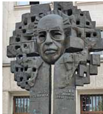
Паметник пред Телефонната палата в София

В началото на 1970-те години името на Атанасов и българските му корени нашумяват в България. Повод за това става книгата на Ричардс, в която за първи път се споменава работата му, а покрай шумното съдебно дело стават известни подробности от живота му. Благовест Сендов първи издирва адреса на Атанасов и му пише. Атанасов отговаря с писмо през септември 1970 г., в което описва живота си, дава сведения за изобретението си и за водените дела и изявява желание да посети България. След покана от името на Българската академия на науките Атанасов и съпругата му посещават България за три седмици в края на 1970 г. в рамките на тримесечна обиколка на Европа. Награден е с орден „Кирил и Методий“ първа степен и изнася няколко лекции в БАН. Посещава и родното място на баща си – с. Бояджик, Ямболско, където се среща с далечни роднини.