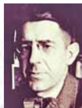
•19. 130 г. от рождението на Чавдар Мутафов, български белетрист, художествен критик и есеист (1889 – 1954);