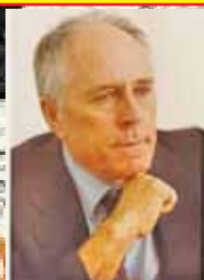
Николай Хайтов, български писател (1919 – 2002);