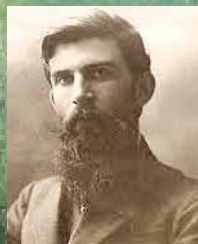
•26. 140 г. от рождението на Петко Тодоров, български белетрист и драматург (1879 – 1916);