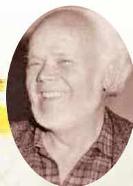
•21. 115 г. от рождението на Стоян Венев, български живописец и карикатурист (1904–1989)