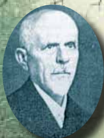
•20. 160 г. от рождението на Никола Начов, български писател, историограф, библиограф и етнограф, (1859 – 1940);