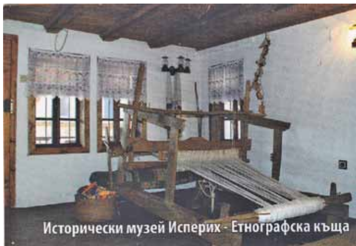
Исторически музей Исперих - Етнографска къща

умение и сръчност. Показани са много носии, сред които доминират добруджанските. Те са главно от четиридесетте години на XX век. Има автентичен костюм на преселници от Северна Добруджа.