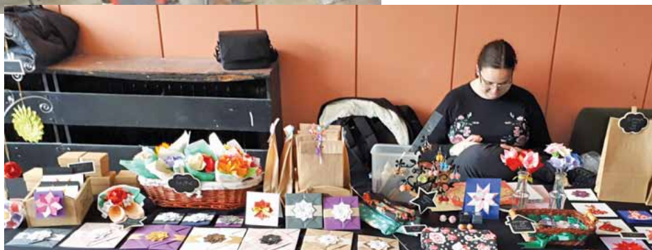
Работен момент по подготовката

В програмата, освен песни и танци, беше включен и благотворителен базар с произведения, изработени от