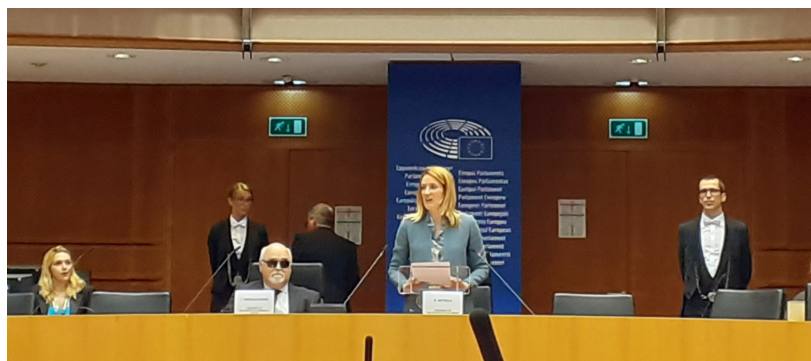
г-жа Роберта Мецола - председател на Европейския парламент и г-н Янис Вардакастанис - президент на ЕФХУ откриха форума