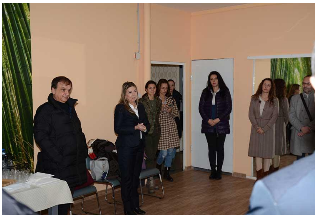
На 3-ти декември - международния ден на хората с увреждания, в специализираното общинско предприятие "Лозана", гр. София, бе разкрито