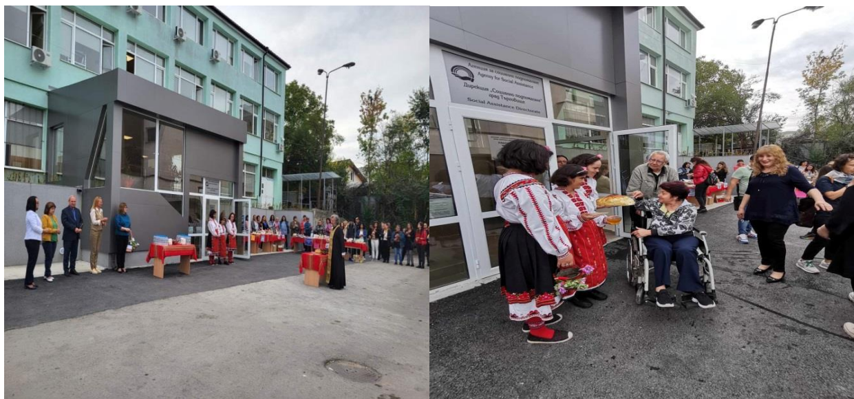
Figure 2 откриване ДСП-11.10.12024г.

В РО Търговище през това тримесечие продължи популяризирането на Проекта на МТСП „Предоставяне на високотехнологични помощни средства за хората с трайни увреждания“. Предоставяха се информации и консултации, разпечатваха се и се попълваха документи. Дирекция „Социално подпомагане“ в Търговище вече разполага с обособен вход и административен салон, пригодени за хора с увреждания по проект „Модернизация на Агенцията за социално подпомагане“, финансиран по Националния план за възстановяване и устойчивост. Ремонтът на сградата на Дирекцията е на стойност 238 000 лв. На 11.10.2024г. реновираната сграда бе открита с водосвет за осветяване. По покана на Дирекцията на церемонията присъстваха председателите на РО на СИБ – Търговище и ОО- Търговище, членове. Проявата бе отразена в сайта на АСП, Информационен бюлетин „Кураж“, БТА и местни медии.