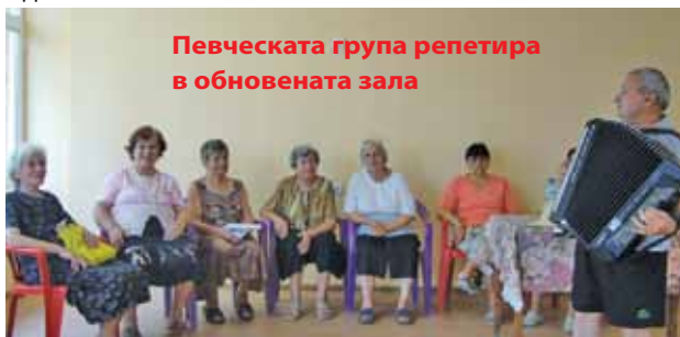
Певческата група репетира в обновената зала