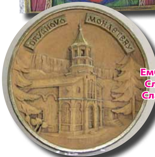
Емблема Славчо Славчев

Надявам се, хората от държавните институции и столичната обществе-