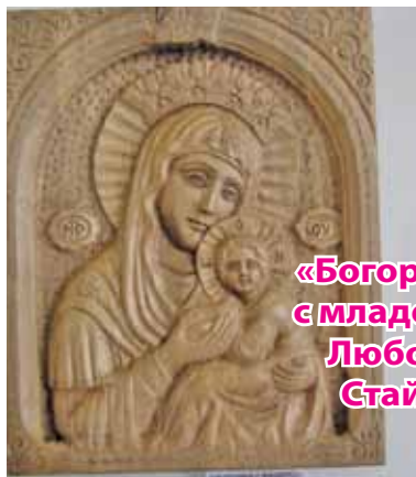
«Богородица с младенца» Любомир Стайков