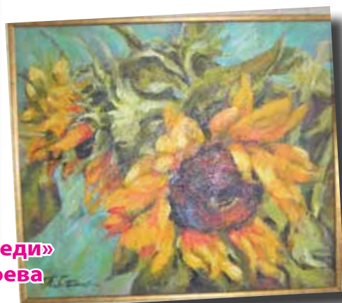
«Слънчогледи» Паола Стоева