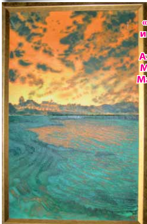
«Небето и морето край Ахтопол» Мариана Маринова