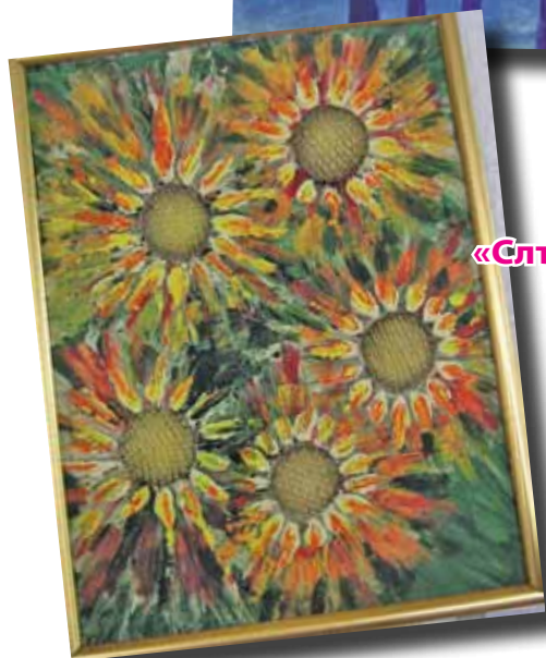
«Слънчогледи» Янка Трачук