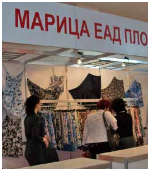
Изящни са дамските облекла, предлагани от ТПКИ „Марица“ от Пловдив