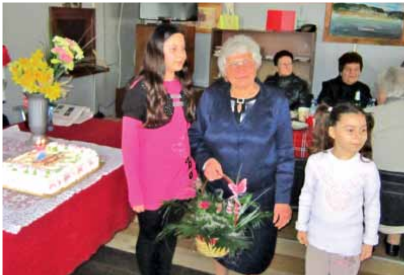
На празника - с приятелите и внуците

След загубата на съпруга си, останала с малка пенсия, търси допълнителен доход, за да може да се справи с непосилните разходи по поддръжката на дома си. На 60 години става детегледачка на 3-месечно момиченце. И тук се справя отлично. Отговорна и неповторимо любвеобвилна завладява малките сърчица и за тях тя е истинската баба. След 3-годишно гледане не изоставя възпитанич-