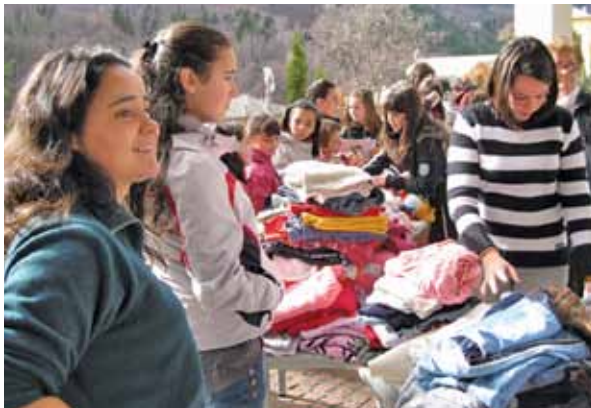
Заедно празнуваме 3 март и Баба Марта

На първия ни общ празник на Смолянските езера много приятно ни изненада това, че децата се включиха в пиеската от хартиени кукли, която бяхме подготвили за тях. Включиха се равностойно и във всички други игри. Мога спокойно да кажа от името на всички доброволци от "Чисти сърца", че тези моменти с