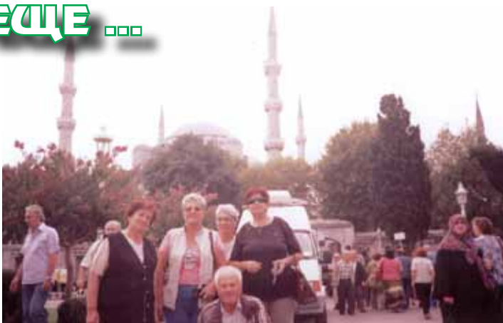
Турция - на почивка в Кушадаш