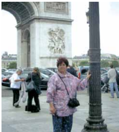
Париж - на Шанз-Елизе

И вярвам, че и вбъдеще ще работим все така здраво за достоен живот, за равнопоставеност в обществото. ■