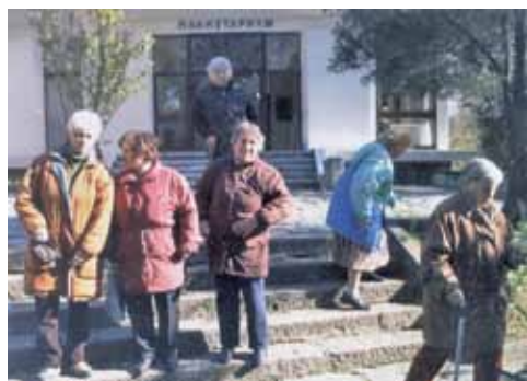
В Планетариума в Смолян

ЗНАЕМ, ЧЕ ОСНОВНАТА НИ ЗАДАЧА Е ДА ПРЕДСТАВЛЯВАМЕ, ОТСТОЯВАМЕ И ЗАЩИТАВАМЕ ИНТЕРЕСИТЕ НА ХОРАТА С УВРЕЖДЕНИЯ. Затова на първо място се стремим да информираме добре нашите членове, да ги запознаем с правата им. Направихме ►