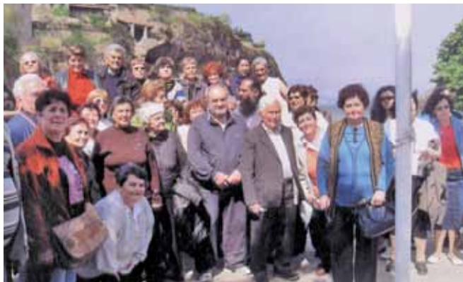
На екскурзия в Гърция - Метеора

Ръководството на нашата организация има създадени добри отношения с много производствени предприятия и частни фирми, от които получаваме дарения в натура или пари. Разбира се, и за това се води изрядна документация. Неотдавна получихме 800 лв, с част от тези пари купихме тренажор. В клуба имаме и масажор, кростренажор, бягаща пътечка, уред за гръбни и коремни преси. Измерваме безплатно кръвното налягане, посещаваме болните, при необходимост им пазаруваме, оказваме помощ на самотните ни членове по различни поводи – за