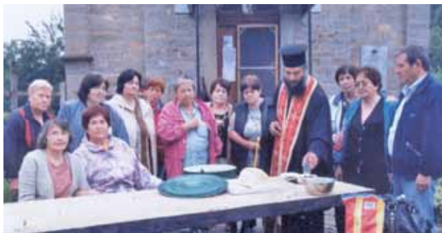
Курбан на Батошевски манастир в Стара планина