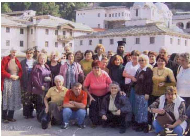
Гърция - манастир «Икосифенида»

ремонт на жилище, при спорове и пр. На всяко тримесечие нашите членове получават и карти за градско пътуване с Бус-Авто на символични цени – 10 лв.