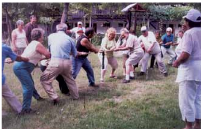
Спортен полуден на Килифаревски манастир в Стара планина