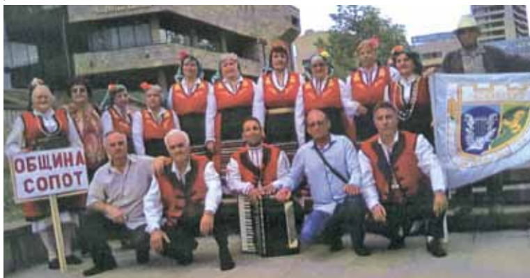
Певческа група „Веселяци“ и „Росна китка“ на фестивала в Смолян - 2015

три медала – златен, сребърен и бронзов.