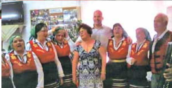
Връчване на народните носии