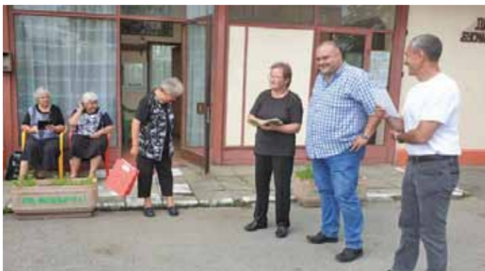
Подаряваме жест на внимание на хората с увреждания по празници

Встремежасидаработим за подобряване качеството на техния живот, им помагаме за преодоляване на трудностите и за интеграцията им в обществото. За да не бъдат социално изключени, създадохме Център за социална интеграция и