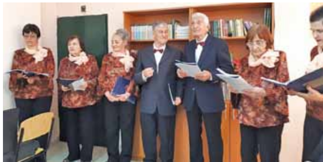
Вокална група „Искра“, сформирана от членове на Клуба на инвалидите, военноинвалидите и пенсионерите в ж.к. „Дружба-1“