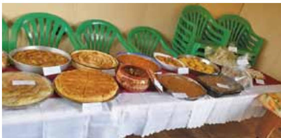
Кулинарна изложба, подготвена от членове на Дружеството на СИБ в Бусманци

Ежегодно в район „Искър“ отбелязваме и празника, посветен на Международния ден на хората с увреждания - 3 декември, за да напомним на тези хора, че мислим за тях.