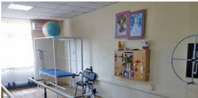
Център за социална интеграция и рехабилитация „Хиляда истории и една мечта“

Потребителите на социалните услуги, предоставяни в Центъра, са основно деца с тежки заболявания, нуждаещи се от постоянни грижи и специализирана помощ за социална интеграция. За подпомагането им, от 2016 г. в Центъра работят логопед и арт-терапевт, а от август 2017 г. - и рехабилитатор.