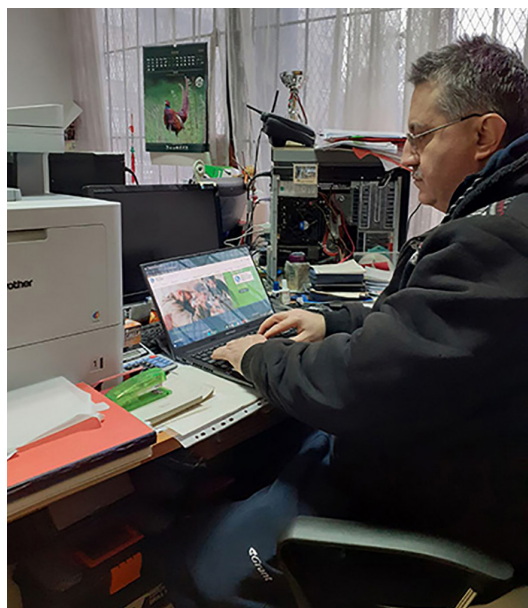
Приспособяване на работното място в клуба на СИБ гр. Сливен